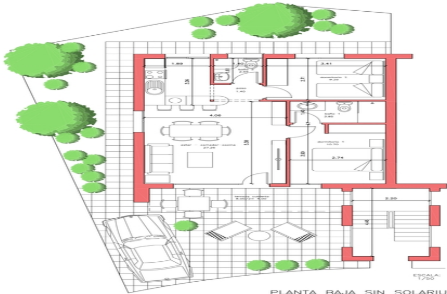
PLANTA BAJA SIN SOLARIUM VIVIENDA 054 SUP. PARCELA= 151,90 M2.

SUP. UTIL : 59,00 M2. SUP. CONSTRUIDA: 70,00 M2. SUP. DE PARCELA NETA: entre 117,00 y 201,00 M2.